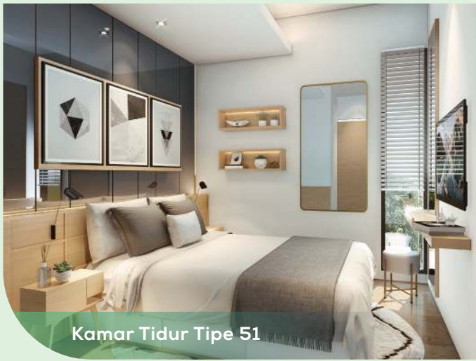
Kamar Tidur Tipe 51