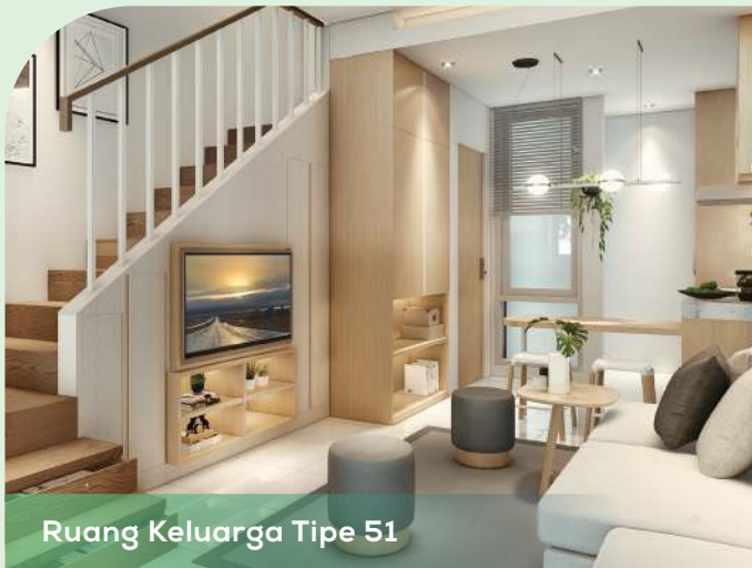
Ruang Keluarga Tipe 51