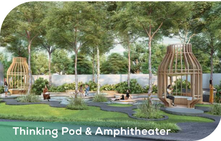
Thinking Pod & Amphitheater