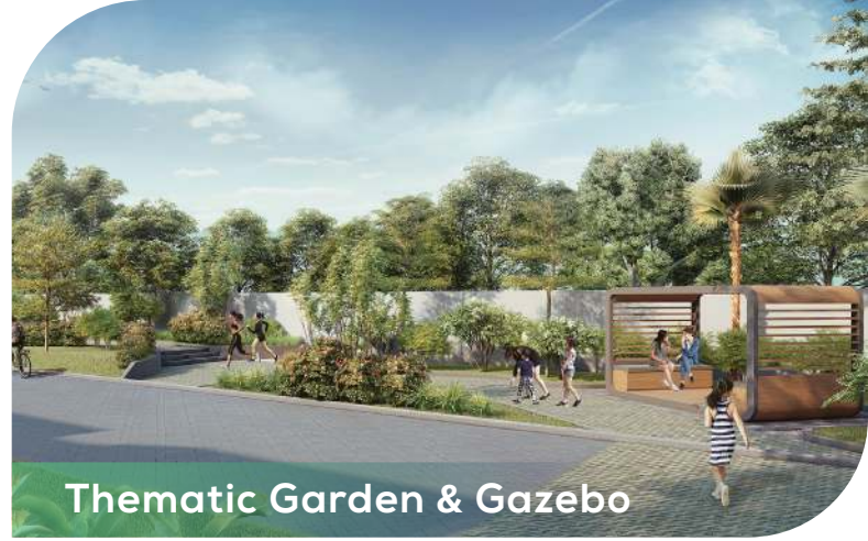
Thematic Garden & Gazebo