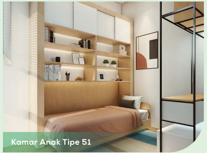
Kamar Anak Tipe 51