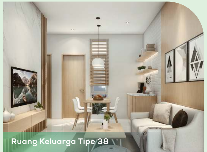
Ruang Keluarga Tipe 38